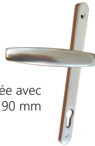
Poignée avec entraxe de 90 mm

Comme toutes les gammes de KÖMMERLING, elle est conçue à partir du PVC greenline, une matière première sans adjuvants à base de métaux lourds. Ces derniers ont été remplacés par une formulation calcium-zinc, qui assure au PVC les mêmes performances que la matière traditionnellement employée. C'est aussi une gamme complète et optimisée permettant une rationalisation de la production et des stocks, elle est estampillée Marque NF Profilés de fenêtres en PVC et bénéficie de l'Avis Technique du CSTB.