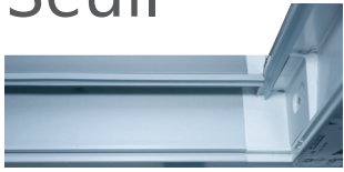
Seuil alu 20mm, à rupture de pont thermique