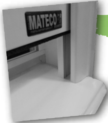
Intégration des coulisses sur châssis ALU