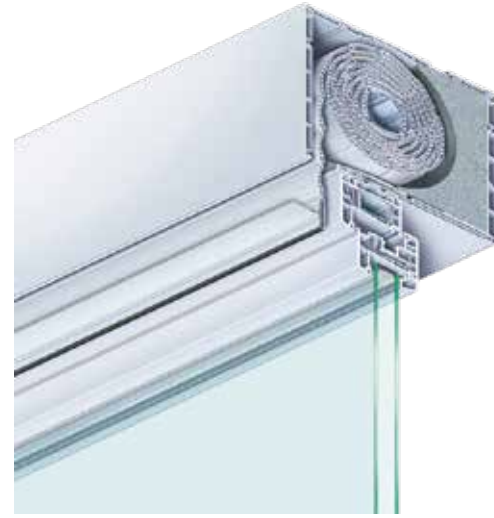
Intégration du caisson sur le châssis - Isolation polystyrène

Le caisson de Volet Roulant Kömmerling est fixé directement sur le châssis PVC de la fenêtre, réalisant ainsi une combinaison 100% Kömmerling . Nous utilisons également le même caisson pour les menuiseries ALU.