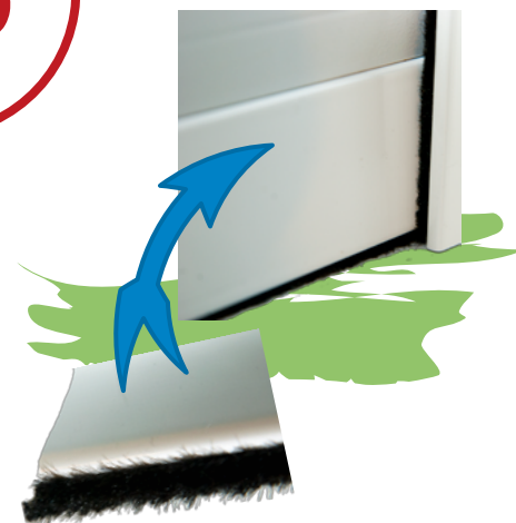
Lame finale avec barre de charge et joint d'étanchéité