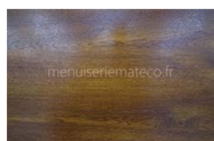
Lisse Chêne doré Ton bois au Style contemporain

Une Finition lisse pour une esthétique plus contemporaine