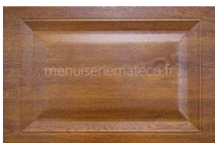
Cassette Woodgrain Ton bois respectant un Style plus traditionnel

Une Finition lisse pour une esthétique plus contemporaine