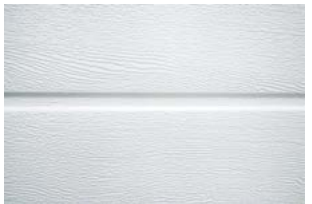
Mono-rainuré Woodgrain Apporte un Rendu très moderne