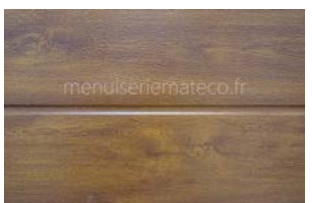
Mono-rainuré Woodgrain Ton bois apporte un Rendu moderne