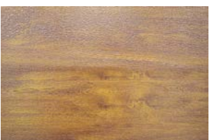
Lisse Woodgrain Ton bois au Style contemporain

La Finition Woodgrain couleur Chêne doré imite le bois sans les inconvénients